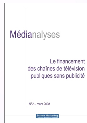
Médianalyse n°2 – mars 2008