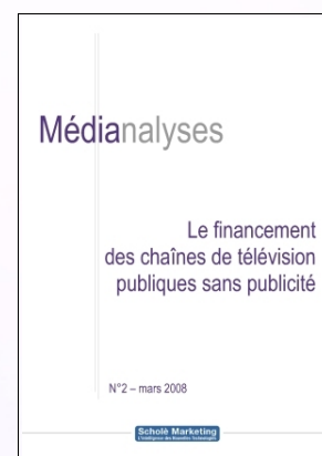
Médianalyse n°2 – mars 2008